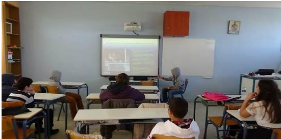
Εικόνα 3. Προβολή της παρουσίασης στην ολομέλεια

Στη συνέχεια σχολιάσαμε τις διαφορετικές συνθήκες επικοινωνίας των νεομεταναστών με τους συμπατριώτες τους σε σχέση με τους μετανάστες προηγούμενων εποχών. Οι μαθητές επεσήμαναν τη συμβολή της τεχνολογίας και ιδιαίτερα των ηλεκτρονικών υπολογιστών στον τομέα αυτό. Τέλος, οι μαθητές σχολίασαν ιδιαίτερα τον αυξημένο κίνδυνο που αντιμετωπίζει η χώρα μας σήμερα από το λεγόμενο brain drain, τη διαρροή δηλαδή «δυνατών» ελληνικών μυαλών στο εξωτερικό.